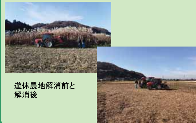
遊休農地解消前と 解消後