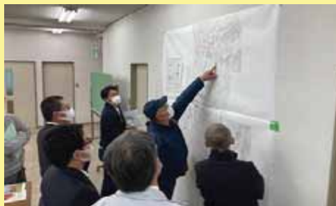
プラン実質化に向けた話し合い(令和2年11月25日)