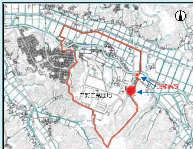
二野地区と取組箇所

○栗畑の耕作者が高齢となり、後継者がいないため耕作の継続が困難となり、農地が遊休農地化した。