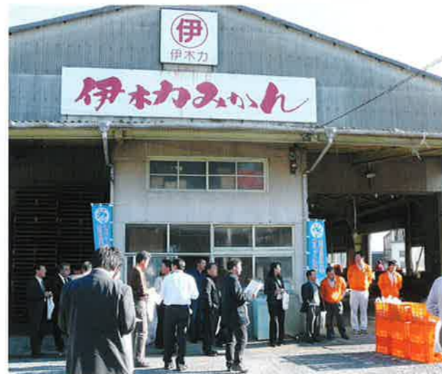
現地視察(県央周辺コース)

なお、 19年度(第10回) のサミットは、 平成19年10月25日(木)～26日(金) に 栃木県内 において開催される。