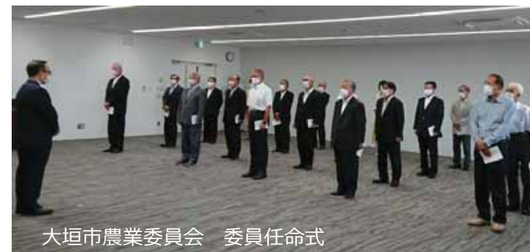
大垣市農業委員会 委員任命式

令和2年7月20日に33農業委員会、8月1日に2農業委員会で任期満了に伴う委員改選が行われ、県内の42農業委員会すべてが新体制2期目に入りました。