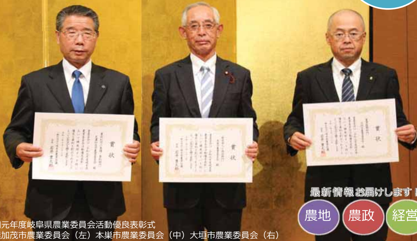
令和元年度岐阜県農業委員会活動優良表彰式 美濃加茂市農業委員会（左）本巣市農業委員会（中）大垣市農業委員会（右）