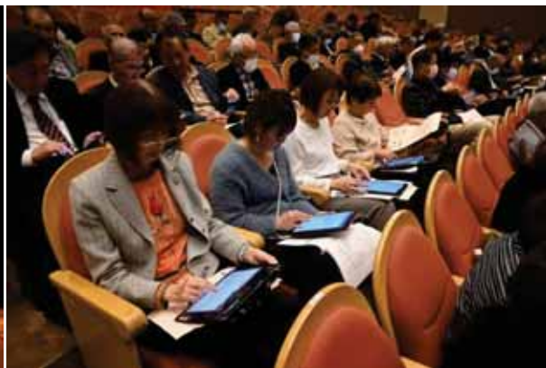
タブレットの操作研修