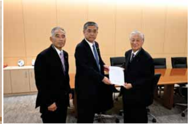
水野県議会議長への提出