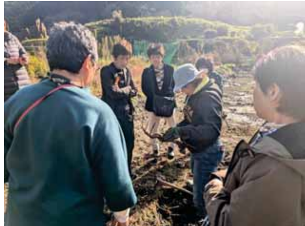
自然派農場しもかわの視察

ばあくでは、ばあくのランチをいただいた後、泉澤代表からばあく設立のきっかけや取り組みについて話があった。