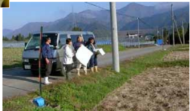
農地の利用状況調査風景

への女性の加入推進、家族経営 協定の推進、地域振興等に取り 組んでいることと、女性が農業 委員として立候補できるような 地域づくり、活動を地域ぐるみ で支援していけるような地域住 民の意識改革をめざしているこ とが評価されたものです。 なお、飛騨市では平成22年 度現在、30名の農業委員 のうち6名が女性委員で全員 が選挙委員です。