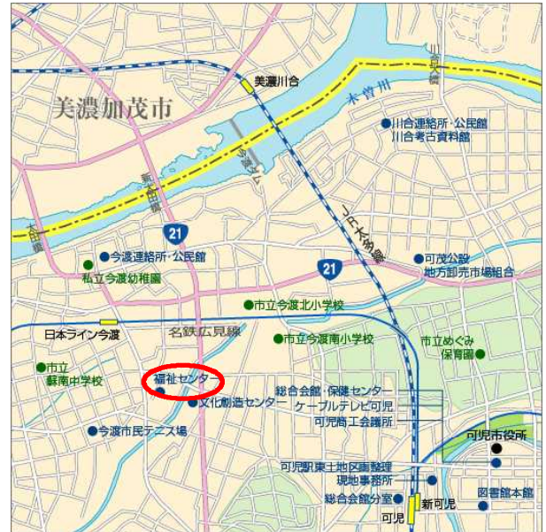
【可児会場】 可児市福祉センター