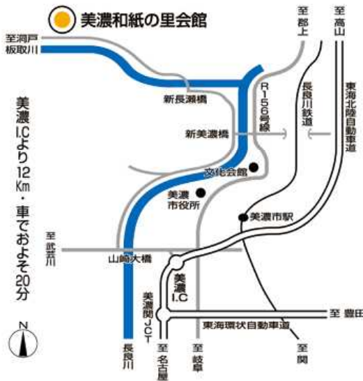
【美濃会場】 和紙の里わくわくファーム