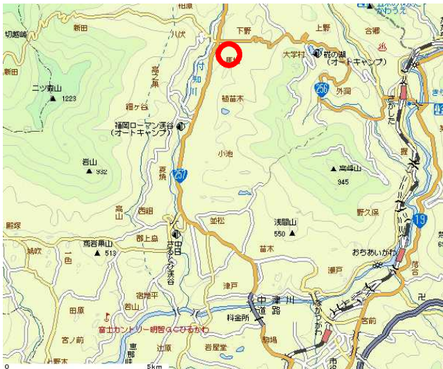
【中津川会場】 恵那北アグリセンター